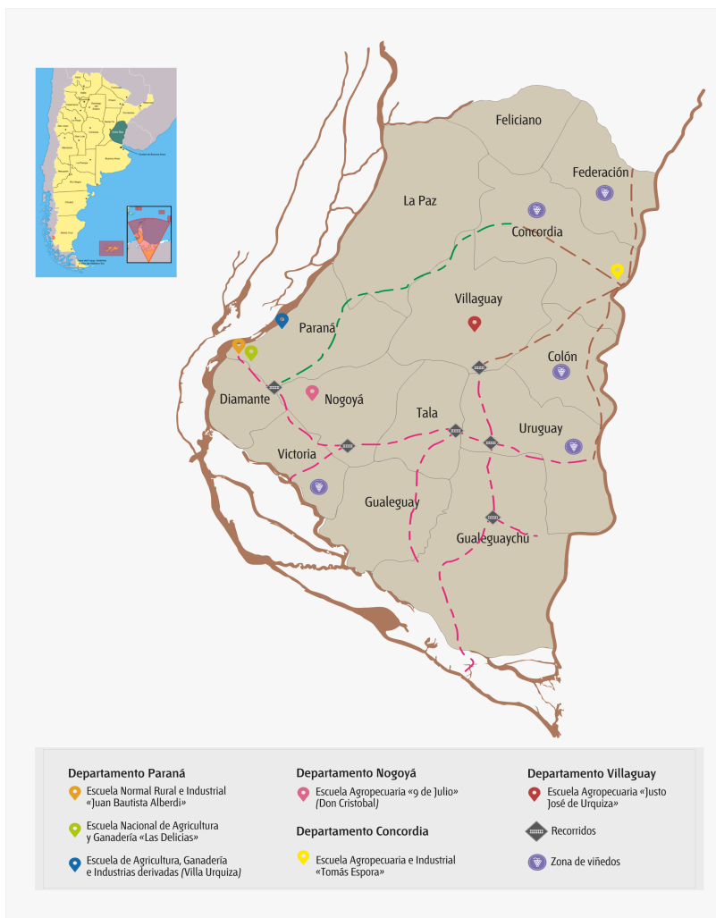
Figura 1. Localización de escuelas agropecuarias y departamentos donde se cultivaba vid. Se respeta la distribución territorial y el trazado ferroviario existente en 1904