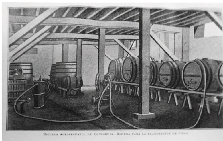
Figura 3. Bodega de la escuela

La puesta en funcionamiento de este tipo de escuela requería insumos y personal especializado que no siempre eran provistos por la Dirección General de Enseñanza. Por esa causa, fueron reiterados los conflictos suscitados por el suministro de elementos para las secciones y por las deudas contraídas para el mantenimiento general. Todo esto motivó la renuncia del director en 1908 (Dirección General de Enseñanza, 1908: 84).