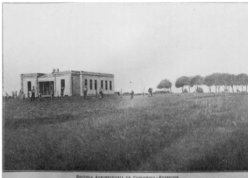
Figura 2. Escuela Agropecuaria de Concordia

El proyecto inicial implicaba la organización de un establecimiento de este tipo, como base de una normal regional, pero finalmente solo fue creada la escuela agropecuaria e industrial Tomás Espora. 6 A tales efectos, en enero de 1904, la municipalidad de Concordia donó a la Dirección General de Enseñanza 30 hectáreas pertenecientes a su ejido, luego ampliadas con 11 hectáreas, concedidas por bodegueros locales, y con nueve más, compradas con dinero resultante de una suscripción popular (Vega, 1905). Su ubicación próxima a la estación ferrocarril (Capdevila, 1989) garantizaba facilidades en el transporte de sus productos hacia otras localidades y provincias vecinas. La tarea de inspección de terreno y dirección inicial de la escuela quedó a cargo del agrónomo sanjuanino Juan Zavalla; la edificación se llevó a cabo en 1904, en base a los planos de una escuela análoga, del departamento Nogoyá (Figura2).