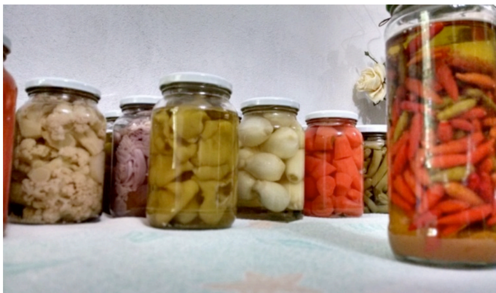
Imagem 1. Produção artesanal de conservas no município de Antônio Carlos

industrializado é quando tu tens uma empresa, igual eu [...], eu até posso dizer que meu produto é industrializado, só que o meu vêm direto da roça, e o dele, ele compra, aí já é uma segunda parte que ele faz, não vêm direto dele, não vêm da colônia. Se eu vendo meu produto pra ti industrializar então quem tá produzindo a mercadoria sou eu. Você só está industrializando, eu não, eu estou produzindo e industrializando, então eu considero colonial.