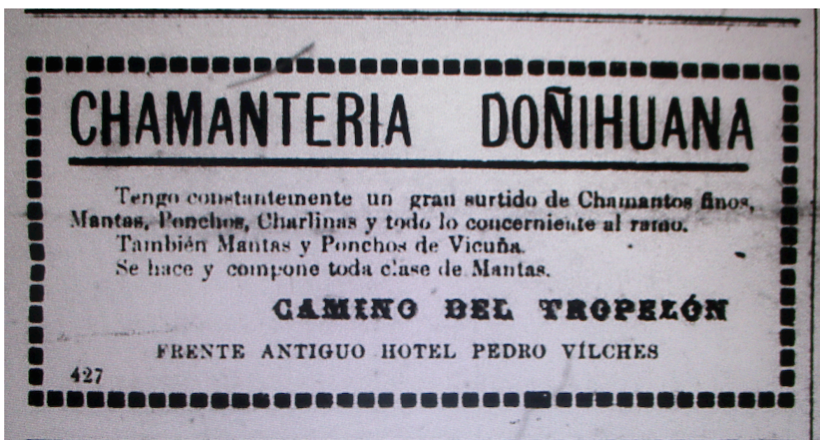
Figura 3. Primer aviso comercial de "La Doñihuana"