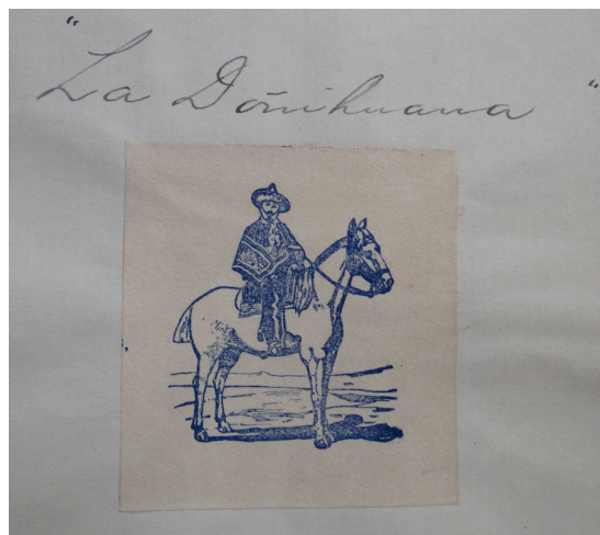
Figura 7. Primer registro de la marca “La Doñihuana” en INAPI

Fuente: INAPI. Registro n° 35987, 23 de junio de 1925.