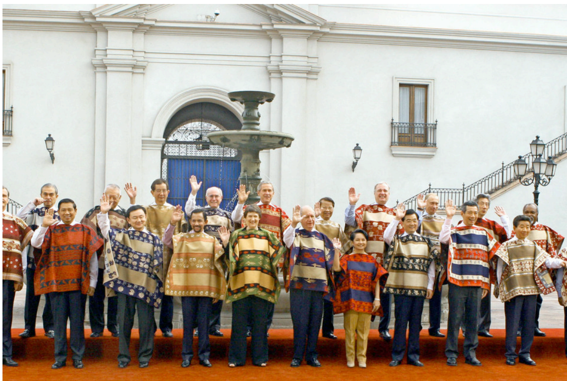
Figura 8. Foto APEC 2004. Líderes políticos vistiendo chamantos doñihuanos