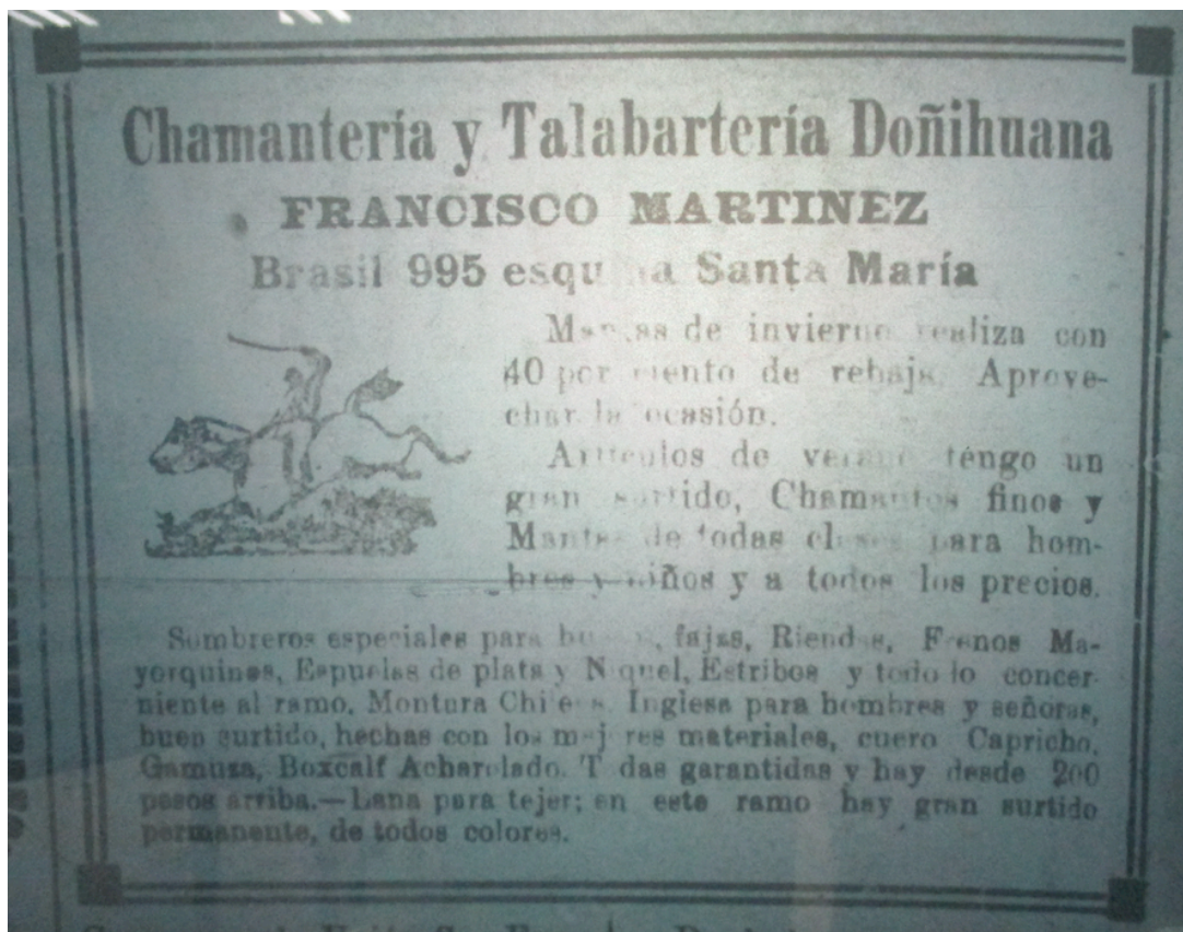
Figura 6. Aviso comercial de “La Doñihuana” con la primera figura de huaso a caballo